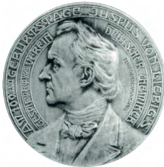
Vorderseite der Liebig-Denk Münze

Die Gesellschaft Deutscher Chemiker e.V. zu Frankfurt am Main verleiht die anlässlich des 100. Geburtstages