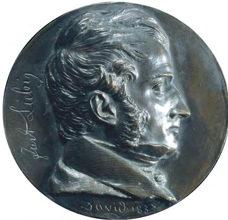
Abbildung aus der Sammlung des Britischen Museums in London (M 6934)